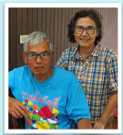
คุณสมพิศและสามีคู่ชีวิต สิงหาคม 2561